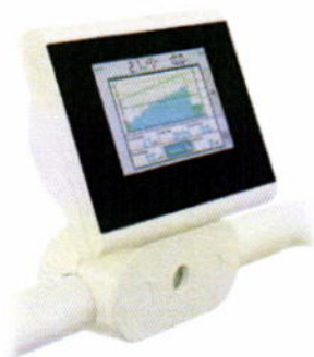
Console de pilotage tactile couleur