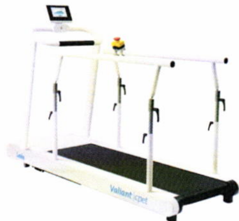
Tapis Valiant 2 avec console, barre frontale, barres latérales réglables et bouton d'arrêt d'urgence

La surface plane de bout augmente encore le niveau de confort et de sécurité du Valiant 2.