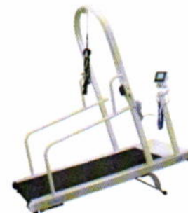
Tapis Valiant 2 sport avec console, barres latérales fixes et arceau de sécurité antichute avec harnais.

Faites évoluer votre Valiant 2 en y ajoutant des options comme le système anti-gravité de soulagement du poids, l'arceau de sécurité antichute ou le module de pilotage par fréquence cardiaque.