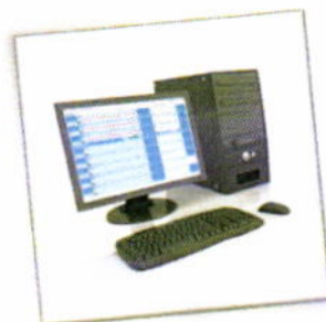
Logiciel de gestion d'ergomètre Lode